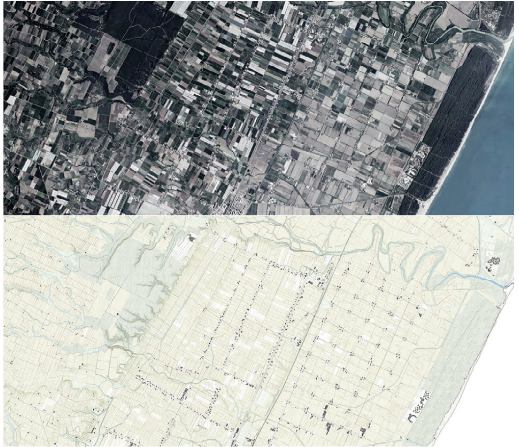
Fig. 4 | Module: Metaponto Plain and its rural patterns (credit: C. Brisotto and A. Raffa; sources: Google Earth and RSDI Basilicata, 2023).