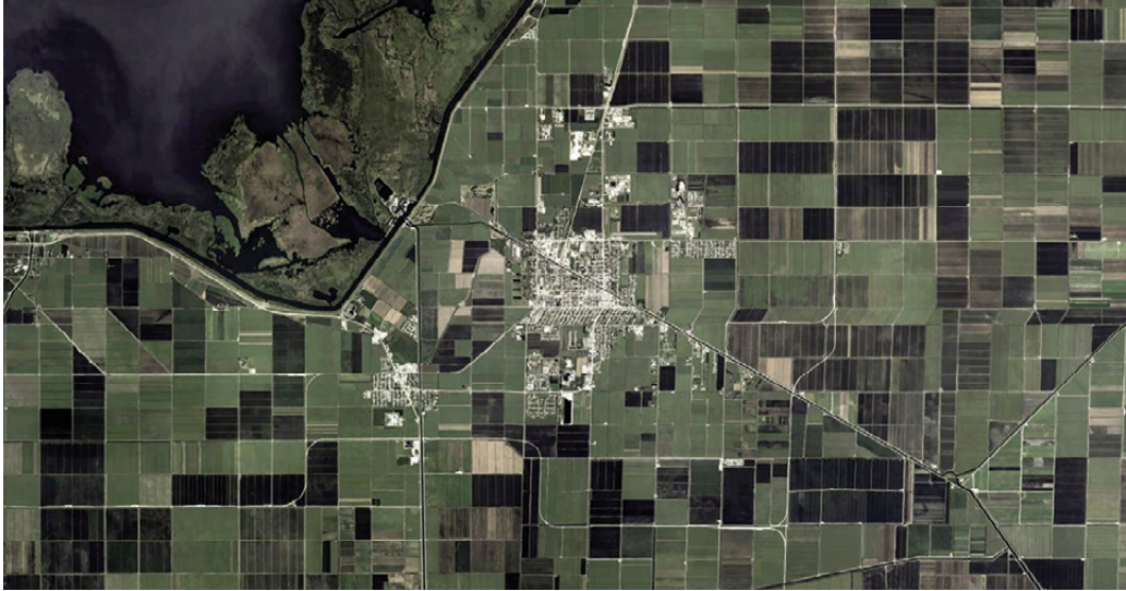
Fig. 13 | Module: EAA settlement infrastructure (credit: C. Brisotto and A. Raffa; source: Google Earth, 2023).

correlation between land and water expressed by the module will have to face a greater complexity and activate a circular rather than a vertical dynamic.