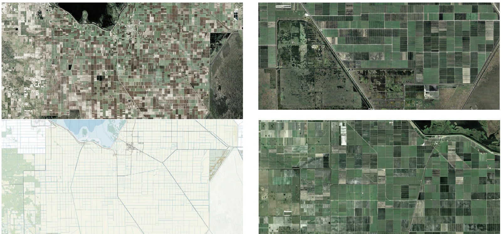
Fig. 10 | Module: EAA, its rural pattern and infrastructural system (credit: C. Brisotto and A. Raffa; sources: UF Geoplan Center-Florida Geographic Data Library e Google Earth, 2023).