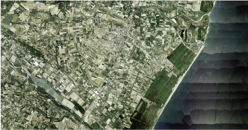
Fig. 7 | Module: settlement infrastructure (credit: C. Brisotto and A. Raffa; source: Google Earth, 2023).

infrastructure of the polder becomes an opportunity to experiment with multiple urban configurations: building densifications and large urban infrastructures alternated to green public spaces for agriculture and recreation, wooded areas and a controlled flooding area with fish farming and re-naturation spaces.