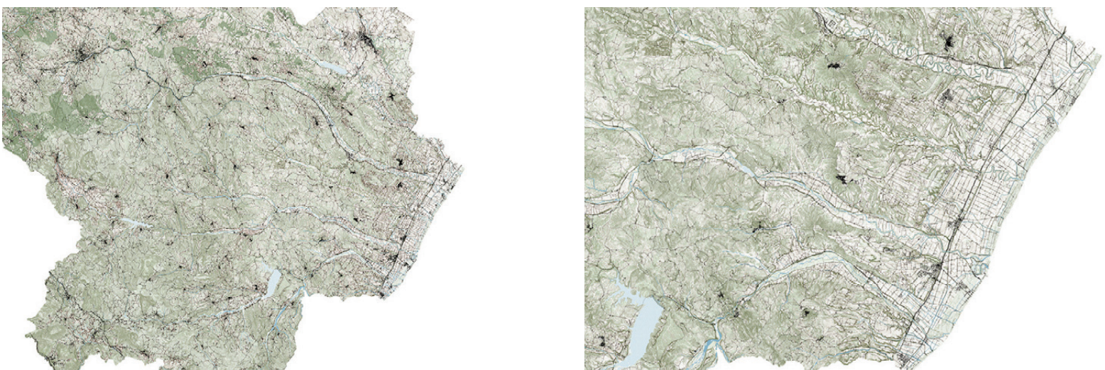
Fig. 2, 3 | Modern Reclamation Landscapes: Metaponto Plain and its territory (credits: C. Brisotto and A. Raffa, 2023; source: RSDI Basilicata, 2023).

A significant approach is the one that led the OMA / Rem Koolhaas studio to the elaboration of the project for Haarlemmermeerpolder (1986). The Dutch studio explores the future urban dimension of a polder starting from its modular structure. The structure is recognized as an ordering and stable element and as an articulation of a multiplicity of possible uses. OMA projects the agricultural armature of the polder soil – a remnant of a centuries-old culture of mutual adaptation between society and environment (van Bergeijk and Piccinini, 2022) – into a new urban dimension where past and future dialogue with the present by juxtaposing architectures, elements, and uses with different relationships with the reclamation module. The aim is to establish unity and coherence without eradicating differences and incongruities (Van Gerrewey, 2015). The plot of the agricultural