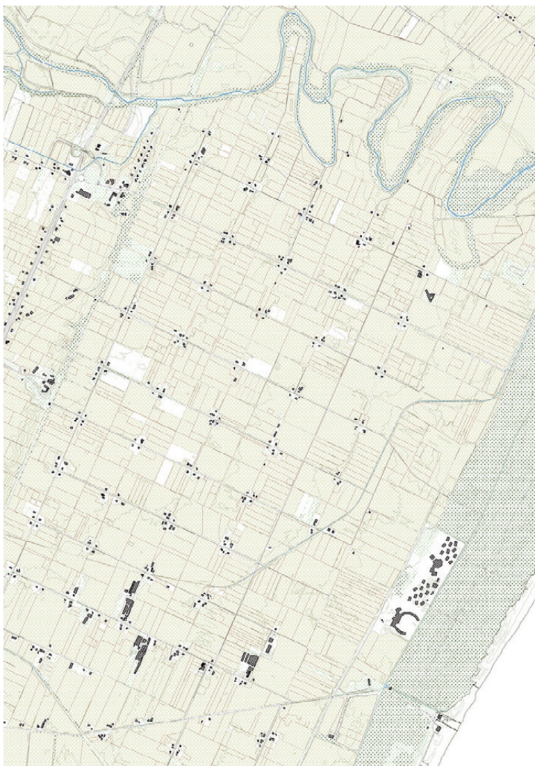
Fig. 5, 6 | Module: rural patterns and concentrated settlement infrastructure (credits: C. Brisotto and A. Raffa; source: RSDI Basilicata, 2023).