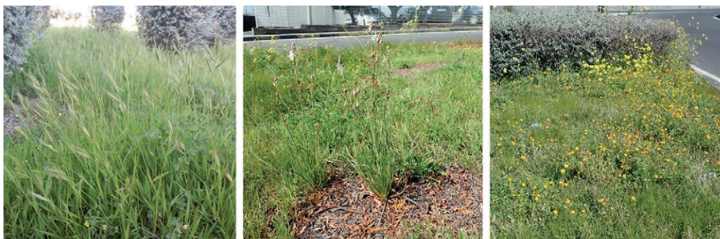
Fig. 3 | Main vegetation-habitat units surveyed in the roundabout of San Giovanni Galermo: (on the left) the annual grass ' Trachynia distachya ', typical of annual swords referred to the class 'Stipo-Trachynietea distachyae'; (in the middle) the hemicryptophyte ' Asphodelus fistulosus ' perennial forb framed into the grasslands included in the class 'Lygeo sparti-Stipetea tenacissimae'; (on the right) ' Calendula arvensis ', annual herb typical of the ruderal communities referred to 'Chenopodietea albi' (credits: C. Catalano, 2023).

L'uso crea modelli, discontinuità ed ecotoni: in una delle aree di studio la prevalenza di vegetazione nitrofila sotto la chioma degli alberi e vicino ai bordi delle strade è dovuta all'effetto combinato del maggiore apporto di nutrienti, legato al frequente passaggio dei cani al guinzaglio e dei loro proprietari, e della copertura arborea, con la sua manutenzione (ombra, accumulo di rifiuti, caduta e rimozione di rami e tronchi). I paesaggisti dovrebbero quindi mettere in pratica in maniera sistemica le conoscenze botaniche in relazione alle condizioni ambientali, all'ampio spettro di 'forme di vita' e 'forme di crescita' delle piante nonché alla fenologia stagionale, legandole strettamente all'uso di uno specifico luogo. L'elevato potenziale ecologico ed estetico della vegetazione spontanea potrebbe così essere utilizzato non solo per