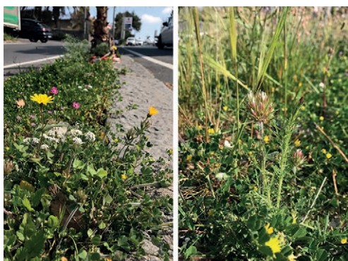
Fig. 4 | Traffic islands in Camporotondo Etneo: (on the left) ' Trifolium stellatum ', ' Calendula arvensis ', ' Lobularia maritima ' and ' Silene colorata '; (on the right) ' Trifolium stellatum ', ' Crupina crupinastrum ', ' Stipa capensis ', ' Medicago ' sp., ' Lotus edulis ' (credits: C. Catalano, 2023).