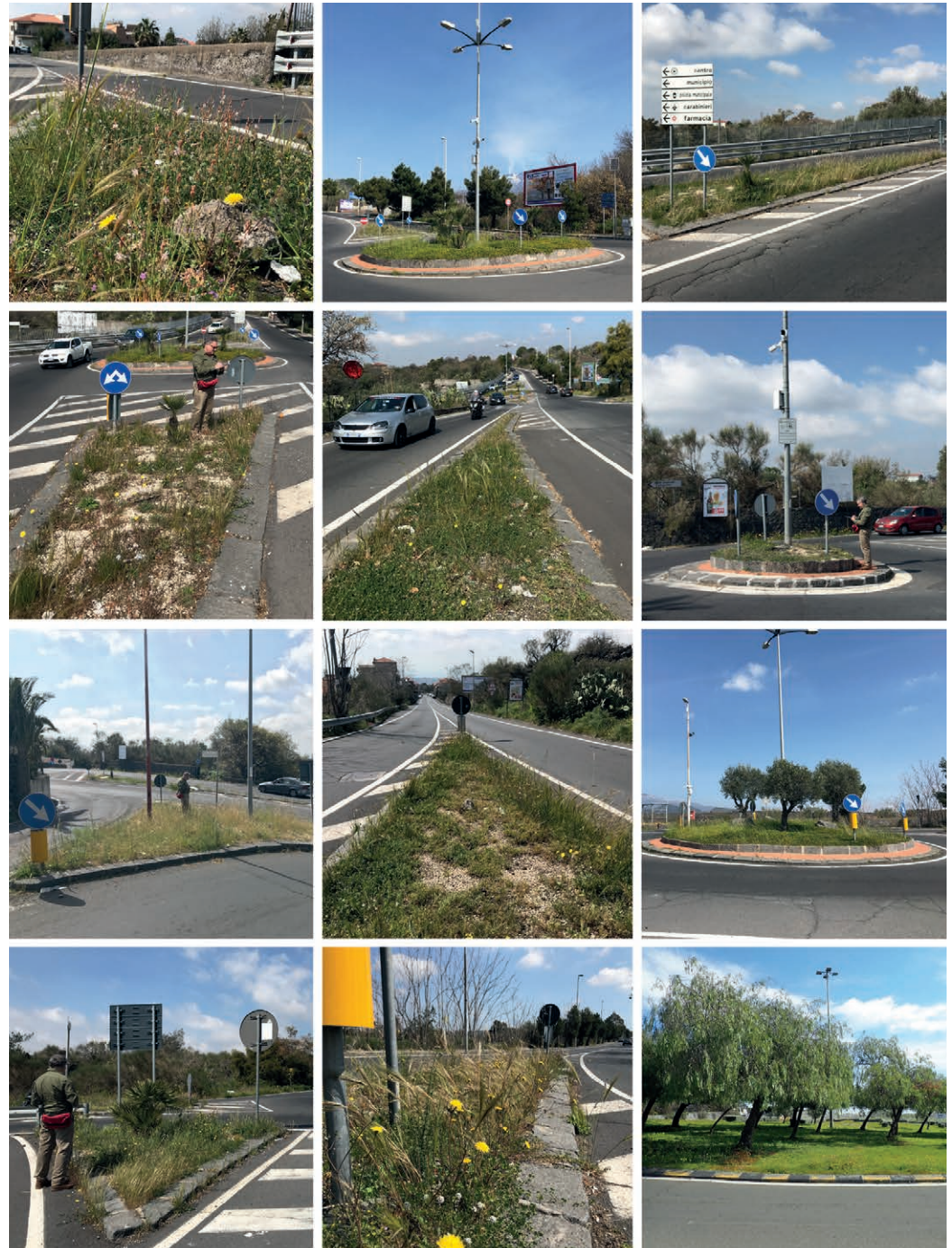
Fig. 1 | Case Studies: Camporotondo Etneo, photos 1 to 11; San Giovanni Galermo, photo 12.

A seconda dell'età di impianto, in assenza di disturbi eccessivi (in termini di intensità e/o di fre-