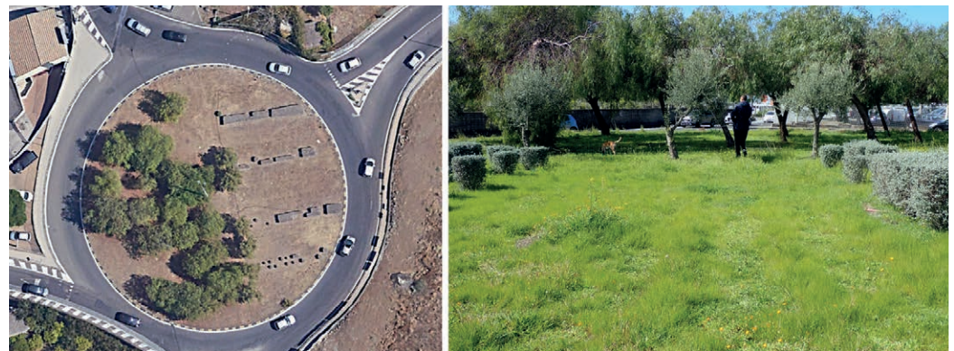
Fig. 2 | Roundabout of San Giovanni Galermo: (on the left) satellite view dated August 2019 by Google Earth Pro; (on the right) view taken between the hedgerows towards the tree plantation – to notice a dog on a leash as a recurrent disturbance factor and the trace of the previously existing irrigation system visible because of the different dominant grasses forming almost parallel stripes (credits: C. Catalano, 2023).