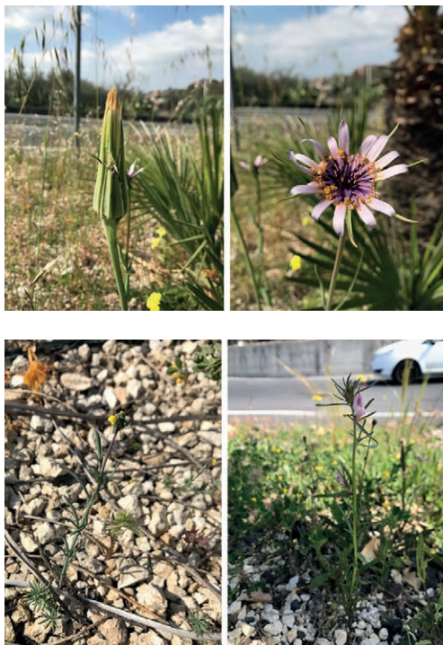
Fig. 6 | Flowering and fruiting plant: (on the left) 'Tragopogon porrifolius', fruiting and (on the right) flowering.

Reading traces | Humans play a key role in shaping urban landscapes. In fact, the regime (i.e., intensity plus frequency) of their daily practices strongly affects both the species composition and the struc-