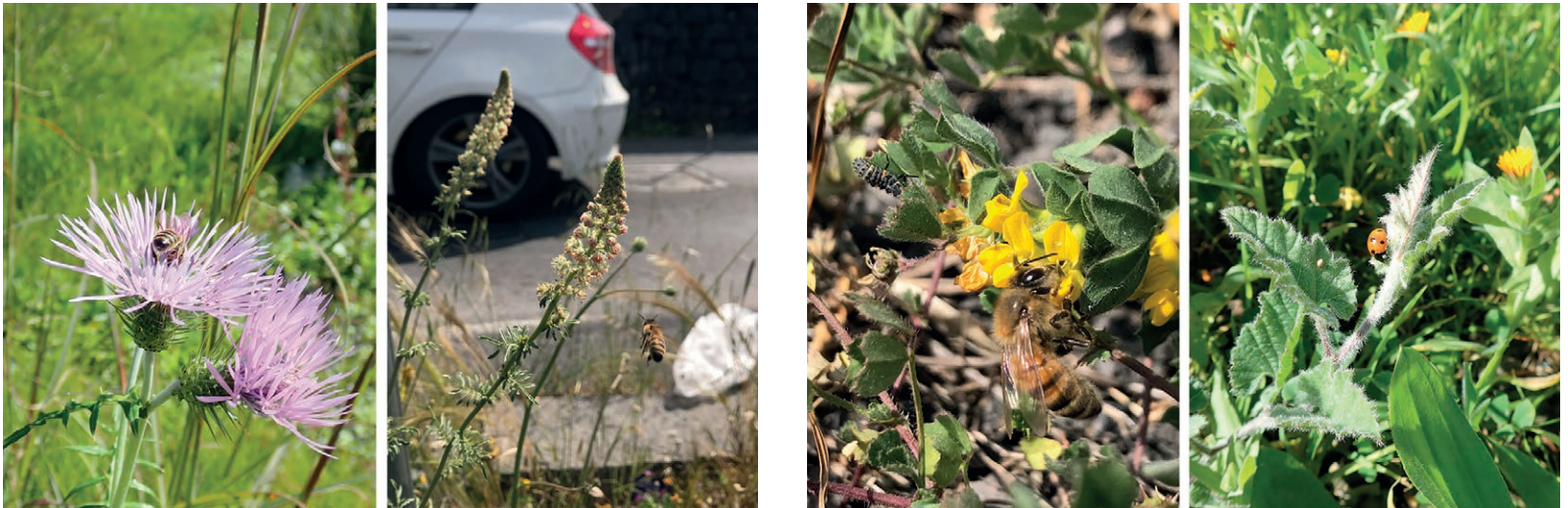
Fig. 8 | Flowers with visiting bees: (on the left) ' Galactites tomentosus '; (on the right) ' Reseda alba ' – both annual forbs of the ' Chenopodietea ', weed segetal and ruderal community typical of man-made habitats.