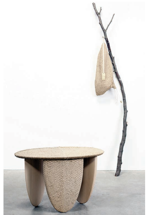
Figg. 3, 4 | Craftica (2012) is a visual and tactile investigation into leather commissioned by Fendi. The design is driven by the symbolic connotations of leather, a material that, more than any other, represents the complex relationship between humans and nature. Leather as a material can evoke almost ancestral memories of when nature was hunted to produce food, tools and protection for the body. Searching underneath and above the sea, from the vegetal to the animal world, the installation offers a holistic view on leather as a material. For the project, Formafantasma utilised discarded leather, left over from the Fendi manufacturing processes. In addition to this, the designers selected a range of leathers obtained from fish skins discarded by the food industry, vegetal processed leather using natural substances from tree bark, cork leather extracted from cork trees, leaving them unharmed and a series of animal bladders investigated for their abilities to hold liquids. The installation displays a large variety of objects ranging from tools to furniture. Concept and Design: Studio Formafantasma – A. Trimarchi and S. Farresin; Development: F. Zorzi; Production: A. Trimarchi, S. Farresin, F. Zorzi, B. Van Nerven, Fendi, Atelier F and M. Lunardon (credits: L. Zanzani).