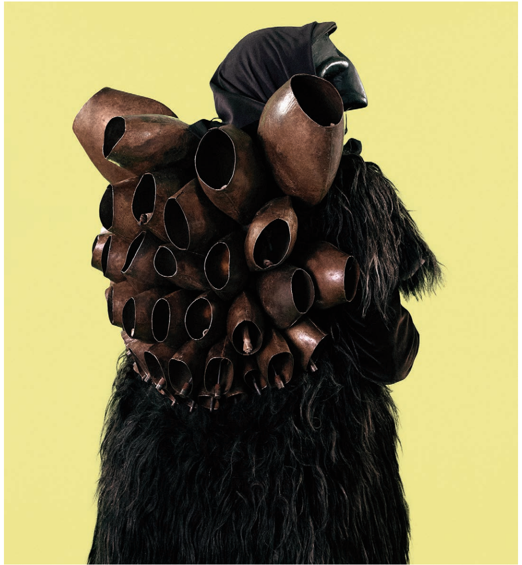
Fig. 15-17 | Oltre Terra (2023) is a design exhibition that investigates the development of the extraction, production and distribution of wool products in relation to the biological evolution of sheep. Oltre Terra aims to redesign how materials, objects and technologies are presented in exhibition-making by including the other-than-human beings that equally contribute to their production. Around 11,000 years ago, hunter-gatherers began to follow and cull flocks of sheep instead of killing them wholesale. This form of game management led to an intricate and unwitting process of co-domestication, creating the first example of livestock and, over the course of hundreds of years, the domestic sheep as we know it today. The effects of this process, however, have never been solely unidirectional, i.e. from humans towards animals. Rather, a complex co-evolution has taken place: if mankind transformed sheep biologically, through domestication and selective breeding, sheep have in turn powerfully shaped the course of human history by providing wool, nourishment and guidance in territorial exploration, thanks to the practice of transhumance. The wider installation of Oltre Terra , meanwhile, is a critical take on the display mode of the diorama. Commonly used in natural history museums to represent a static scene from nature, here the diorama is exploded, containing six life-size reproductions of different sheep breeds, as well as documents, films, by-products of production processes and various types of organic matter. Materials, techniques and living creatures are presented together to counteract the current categorisations that separate human and animal, product and biological matter. Concept and Design: Studio Formafantasma – A. Trimarchi and S. Farresin; Formafantasma Team: S. Barilli, A. Celli, G. Gonella; Supported by: Fondazione In Between Art Film, cc-tapis, Manteco (credits: A. Celli and G. Gonella).

cause it implicates a situation of perpetual change – a dynamic state that we should probably live in today. The word becomes even more significant when accompanied by the adjective ‘ecologic’: while the term ‘ecology’ – which clearly represents a dimension for contemporary thought and life – is now taken for granted, the idea of transition seems particularly appealing because it presupposes a constant adaptation, a kind of continuous movement that is more complex and significant than the simple idea of transition understood as a passage from one point to another.