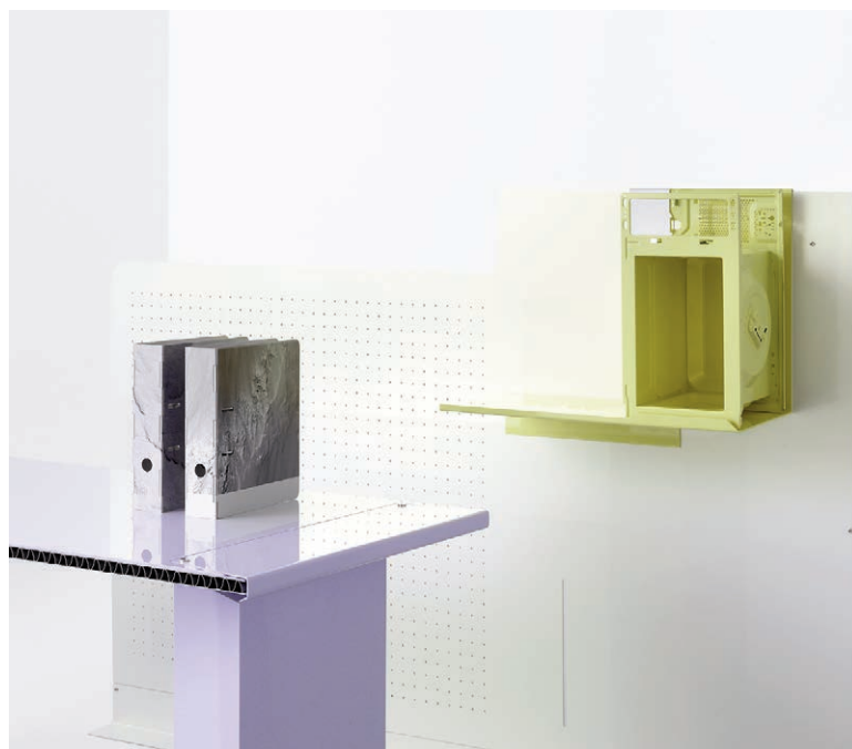
Figg. 11-14 | Ore Streams (2017) is an investigation into the recycling of electronic waste, developed over the course of three years and commissioned by NGV Australia and Triennale Milano. The project makes use of a diversity of media (objects, video and animation) to address the topic from multiple perspectives. The goal is to offer a platform for reflection and analysis on the meaning of production and how design could be an important agent in developing a more responsible use of resources. Ore Streams sets out to identify ways in which design can be deployed to correct the flaws in the current waste-stream system. But beyond systemic improvements, design can be used to induce a subconscious attitudinal shift for the better. The objects created for Ore Streams act as a Trojan horse to initiate an exploration of ‘above-ground mining’ and of the complex role that design plays in transforming natural resources into desirable products. The range of office furniture is constructed using recycled iron and aluminium paired together with deadstock and recycled electronic components. A recurrent element is the use of gold sourced from the recycling of circuit boards to plate details of the objects. At first glance, the objects appear austere and slickly coated. Yet within moments, familiar elements begin to emerge. Concept and Design: Studio Formafantasma – A. Trimarchi and S. Farresin; Design Development: J. Van Der Gruiter; Research and Development: J. Seelemann and N. Verschaeve; Furniture edited by: Giustini/Stagetti, Rome (credits: Ikon).

che gli allevamenti intensivi sono un abominio». La Mostra parte da queste premesse e mette in relazione l’evoluzione tecnica della produzione della lana con l’evoluzione delle specie che si dividono e diventano più efficaci per produrre la lana in un certo modo, piuttosto che il latte o la carne. Seguendo il percorso espositivo si comincia a capire che l’interconnessione tra uomo e animale è molto più complessa di quello che pensiamo e che la tecnica è totalmente collegata al mondo organico e va raccontata insieme, altrimenti non riusciremo mai a produrre pensiero ecologico. «[...] Non si può fare una maglia in lana senza sapere