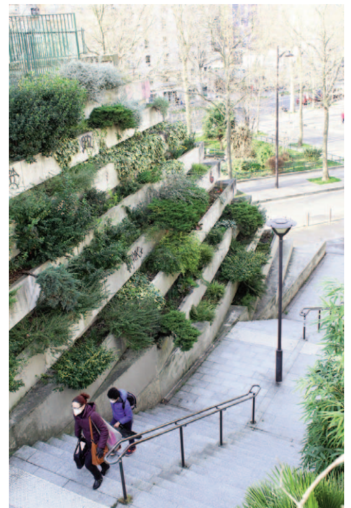
Fig. 3 | The Promenade Plantée becomes a corridor of energy and plant density, bringing nature back into the metropolitan city.