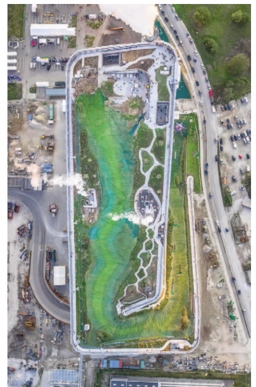
Fig. 9 | The Copenhagen Waste to Energy Plant in Copenhagen: The building's overall view is characterised by a large roof garden formed by three majestic and sculptural ramps.