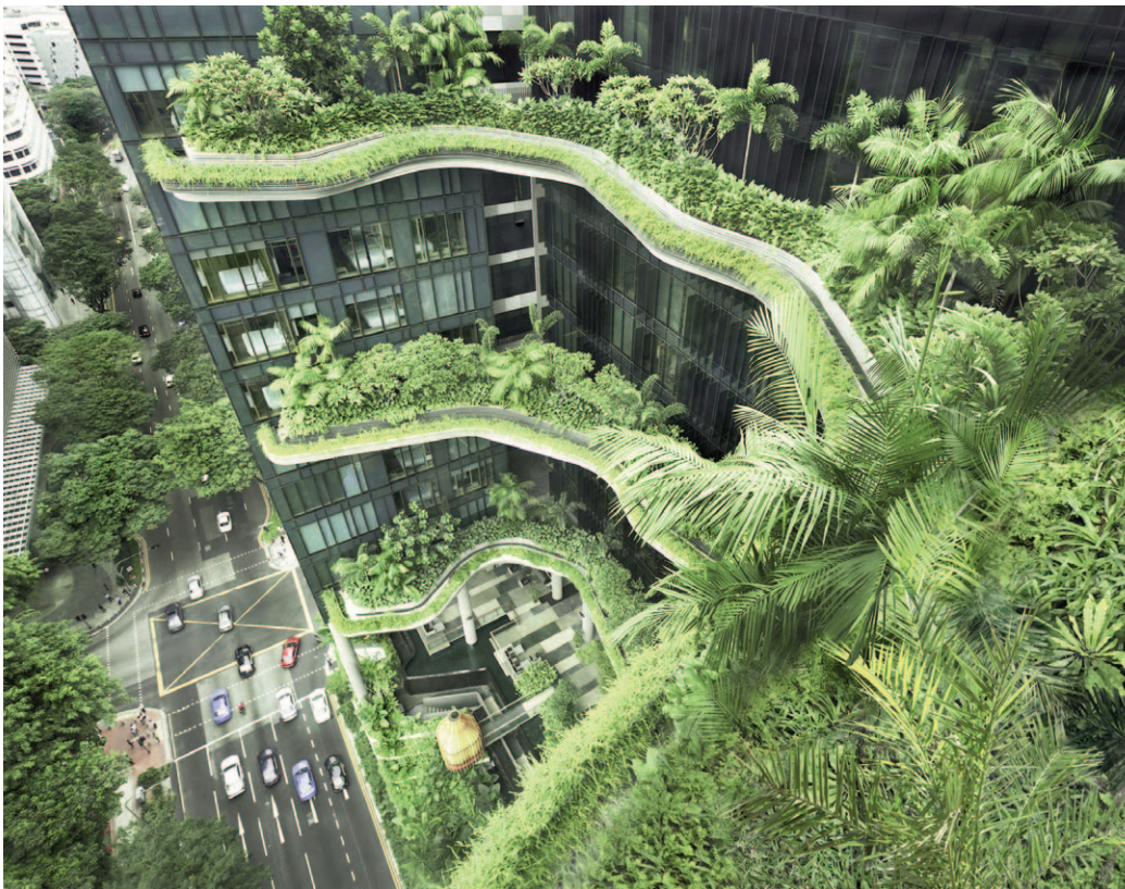
Fig. 15, 16 | Detail of the green roof installed in the basement part of the building, above a stratified artificial soil made of stepped moulded slabs; Detail of the green roof installed on the three cantilevered floors set between the building's avant-corps (credits: Patrick Bingham-Hall, WOHA).

thetic canon of the contemporary world, capable of going beyond its physical and technical values in the design of climate-controlled buildings.