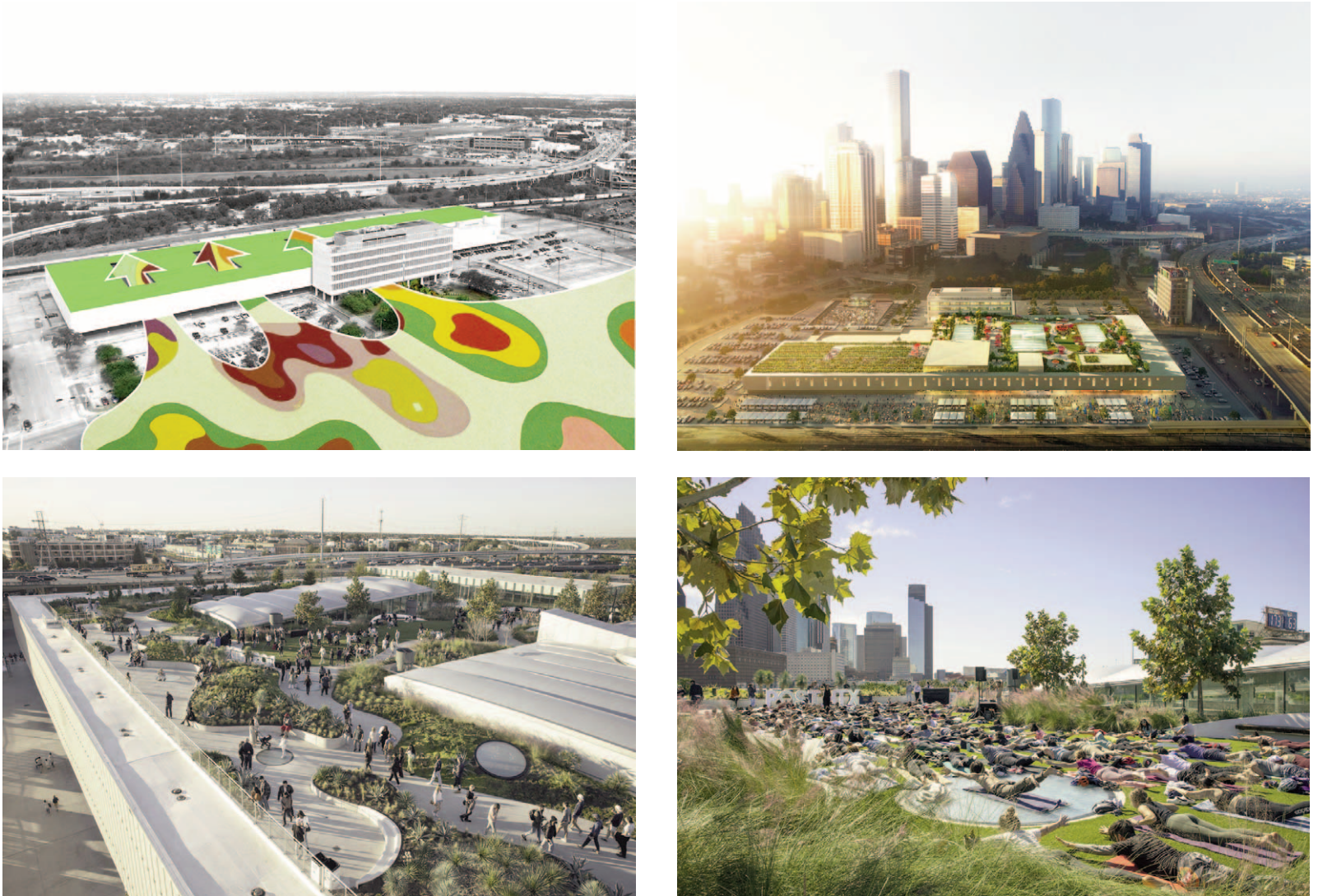
Fig. 5-8 | Design concept of the restoration of the former United States Post Office (2016-22) in Houston, where the reference to R. Burle Marx is declared in the overall resolution of the green roof; Rendering presents the new overall roof arrangement of the former United States Post Office; Views of using the former United States Post Office roof as a public and gathering space serving the city.

ma della città quanto dell'architettura contemporanea, contribuisce a una progressiva (e necessaria) riscrittura della teoria della progettazione, ovvero di quella disciplina capace d'inquadrare le grandi questioni culturali che guidano la pratica progettuale odierna all'interno di un contesto globale, influenzato dalle specificità locali: un palinsesto intellettuale e critico praticabile per recepire gli effetti della pratica professionale e rielaborarli attraverso un dialogo diretto con gli attori coinvolti nell'industria delle costruzioni e nei processi di pianificazione della città e del territorio, per calibrarne i futuri indirizzi e individuare gli apporti transdisciplinari capaci d'influenzarne le prassi.