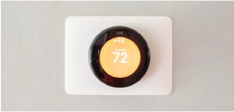
Fig. 9 | Nest.