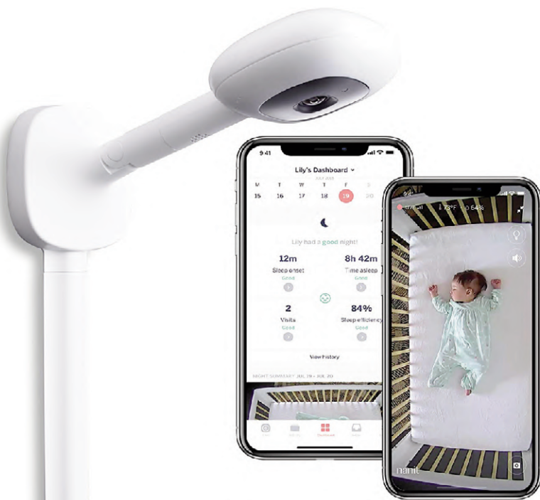
Fig. 13 | Nanit.

Health and well-being, as already stated, are a specific category: ranging from the assistance for the dosage of drugs to more specific types of areas that assist users suffering from a specific illness or disability (blindness, deafness, movement difficulties, etc.). There is a vast and varied range of intelligent security systems dedicated to solutions ranging from anti-theft to baby and child monitors. Some examples in this category are Wyze, Ring Alarm, Nanit and others (Figg. 11-