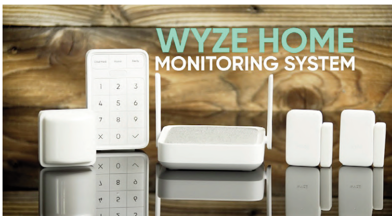
Fig. 11 | Wyze Home Monitoring System.

State of the art | To make a complete analysis framework, it is necessary to identify and briefly qualify the existing solutions dedicated to the smart home, considering different technologies, infrastructures and methods of interaction. At the same time, as a method premise, it is useful to