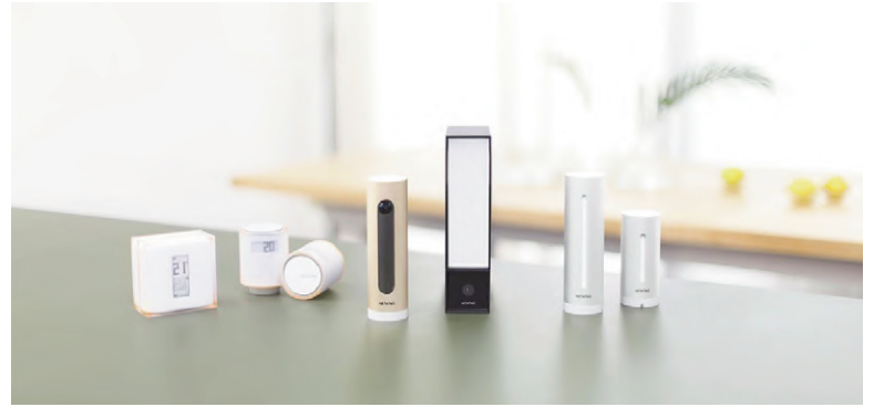
Fig. 10 | Netatmo (source: elektro.tzb-info.cz, 2021).

immaginare e dimostrare l'esistenza di realtà alternative, mondi futuri, con lo scopo di farci riflettere sulle tecnologie e lo sviluppo scientifico. Questi artefatti sono in qualche modo definibili come 'politici': non si limitano alle proprietà materiali e funzionali degli artefatti, ma esplorano i possibili i contesti sociali e culturali che reagiscono alla antropizzazione del mondo con i suoi progressi tecnologici e i mutamenti naturali.