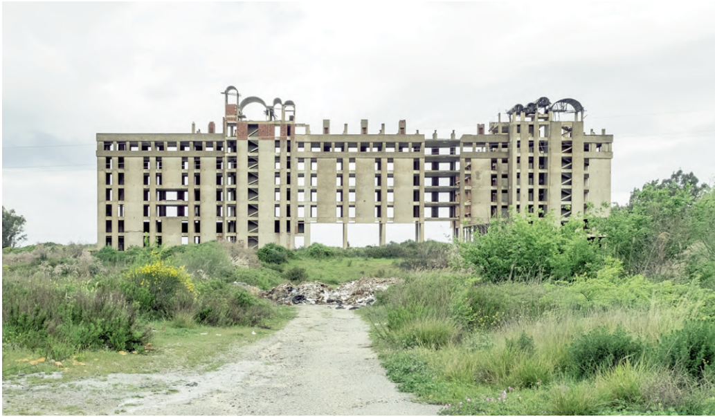
Fig. 1 | Unfinished building in Zeytinköy, Turkey.

costruzioni incomplete ha assunto i contorni di un'emergenza che richiede di essere affrontata con uno specifico approccio progettuale, in quanto si tratta di accostarsi a interventi non riconducibili a nessuna categoria tra quelle abituali, non essendo né ex novo, né di recupero propriamente detto. Infatti, passando dal livello programmatico alla dimensione progettuale, ancora mancano circostanziate indicazioni metodologiche per l'intervento sull'incompiuto; per questo, sarebbe opportuno individuare orientamenti e criteri generalizzabili, che possano rivolgersi al maggiore numero di vari portatori di interesse, adattandosi alle specifiche