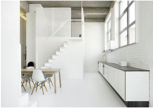
Fig. 15 | adn Architectures, Loft FOR, Bruxelles, Belgium, 2013.

ing marking the entrance to the city with its golden mantle and a large cornice (Fig. 5). The MellusoArchitettura studio's method as applied in a completion project for a semi-detached dwelling in Caronia Marina (Fig. 6) and the Musarra Onlus Foundation headquarters in Capo d'Orlando (Fig. 7) seems similar to the one mentioned above; both projects were carried out in the province of Messina, in 2005 and 2017 respectively. Nothing, or hardly anything, seems to hint at the temporary suspension of time endured by the constructions in question: massive, white-plastered blocks, partly covered with black ceramics or stone, bring distinction to spaces in an advanced state of neglect and to contexts that mostly lack building quality.