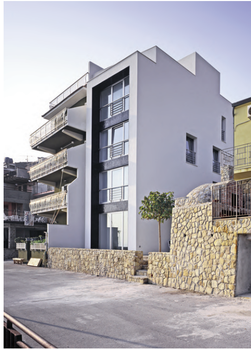
Fig. 6 | MellusoArchitettura, Row semidetached dwelling, Caronia Marina, Italy, 2005.