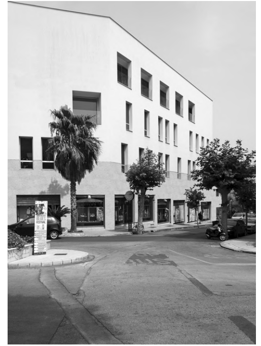
Fig. 7 | MellusoArchitettura, Fondazione Musarra Onlus, Capo d'Orlando, Italy, 2016.

rendous appearance of unfinished constructions' (Germanà, Mamì and Perricone, 1999). One hundred and twenty-seven unfinished buildings were identified in Palermo following extensive reconnaissance work, based on the analysis of aerial photos and subsequent site visits. Although this sample might seem restricted, it still offers interesting general insights (Fig. 3). The period for building construction confirms the feature highlighted above at the national level; only 7% of the unfinished buildings were built after the year 2000. Looking at the intended original use and ownership, the sample shows that unfinished public buildings are actually in a minority: only 5% compared to 22% private; as many as 73% were confiscated from organized crime (a most particular category of real estate, the destination of which, after confiscation, is determined by the National Agency for Seized and Confiscated Assets). 6