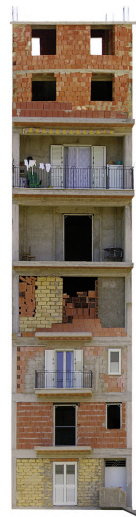
Fig. 2 | Construction 01, Digital collage 2011; Construction 03, Digital collage 2011 (credits: C. Nicotra).