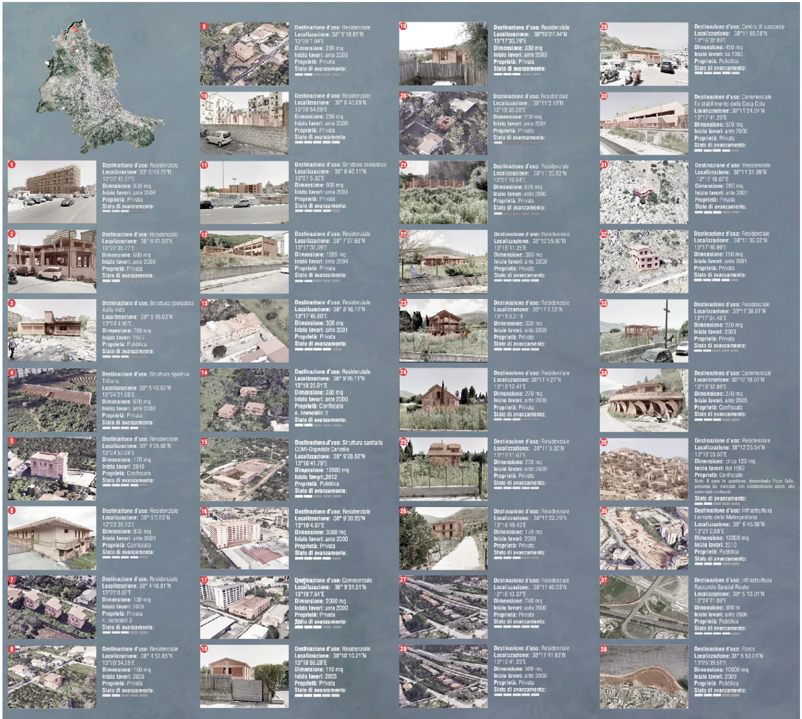
Fig. 3 | Survey of unfinished buildings in the City of Palermo dated September 2020.

Considering the variety of wide-ranging and widespread examples, the unfinished building phenomenon poses a significant research problem affecting public and private stakeholders, who are directly involved as clients with regard to the original building process, either as administrators or owners of the present building. However, the range of stakeholders extends to the social dimension, if we consider that the effects of each construction activity «[...] constitute a value for the community because of the potential benefits in economic, environmental and social terms» (UNI, 1998, p. 1), since every single building entails various consequences for landscape, use of natural resources, well-being and the safety of all.