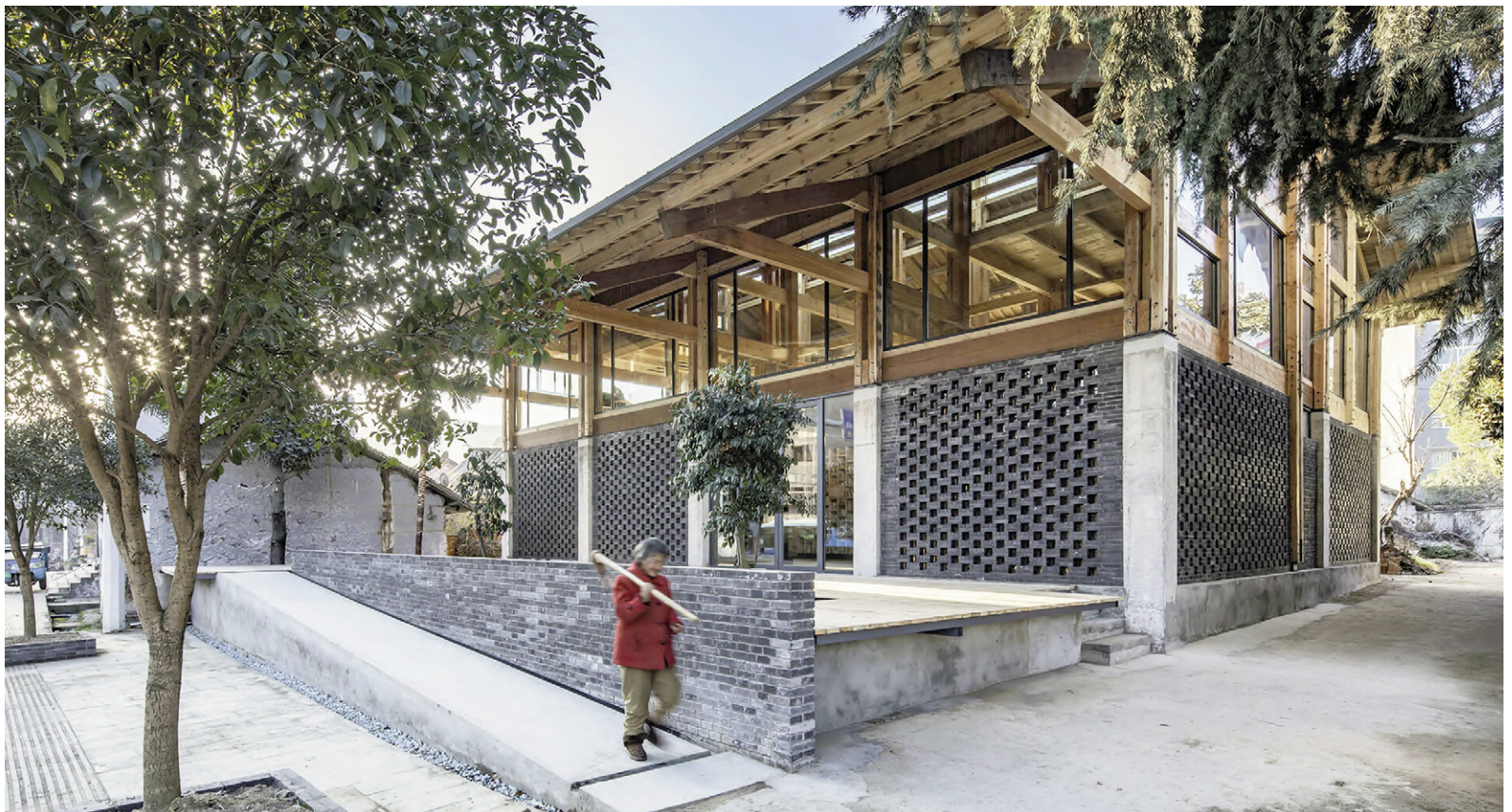
Fig. 12-14 | LUO Studio, Party and Public Service Center, Shiyan, China, 2019 (credits: LUO Studio; Weiqi Jin).