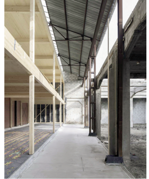
Fig. 8 | Gambardellarchitetti, Casa tra due pini, Itri, Italy, 2012.