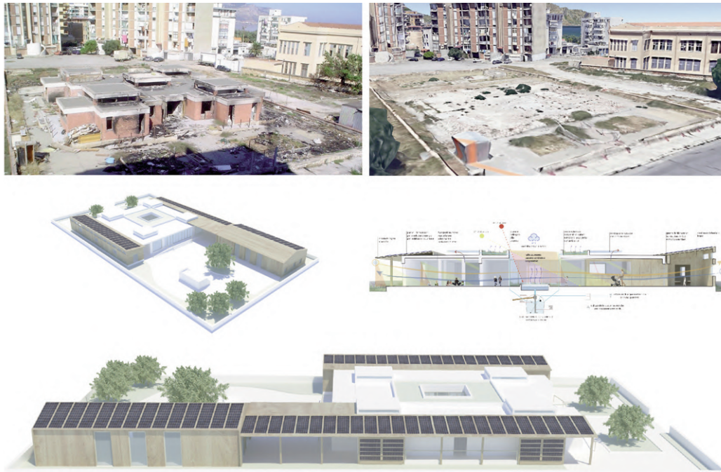
Fig. 4 | Kindergarten in the Sperone district of Palermo, built at the end of the 1970s in a framework of a social housing district; after decades of abandonment and illegitimate use, it was demolished in 2019, providing an emblematic example of ‘repairing demolition’. The condition of abandonment before demolition; The clean slate resulting from the demolition; Design hypothesis by F. Bianco, P. Bruno and L. Di Marco (graphics by F. Anania).

in very different contexts, such as Morocco, Turkey, Taiwan, Spain, Portugal and the United Arab Emirates (Fig. 1). 1