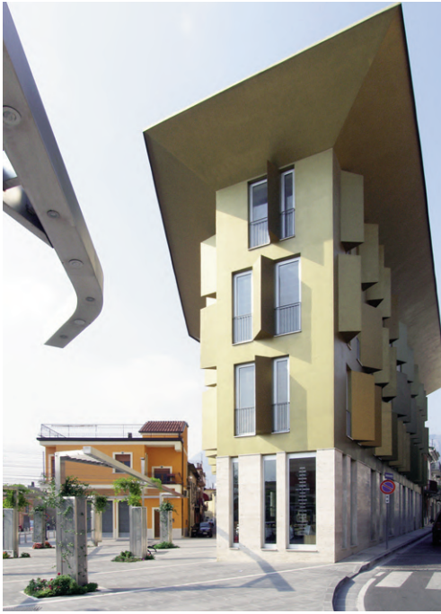
Fig. 5 | Gambardellarchitetti, Palazzo D'Oro, Montesarchio, Italy, 2004.