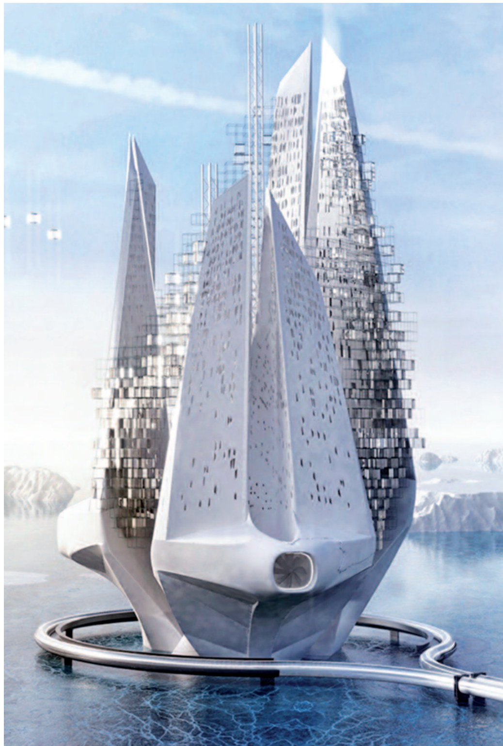
Fig. 8 - Rendering del grattacielo Heal-Berg, California.