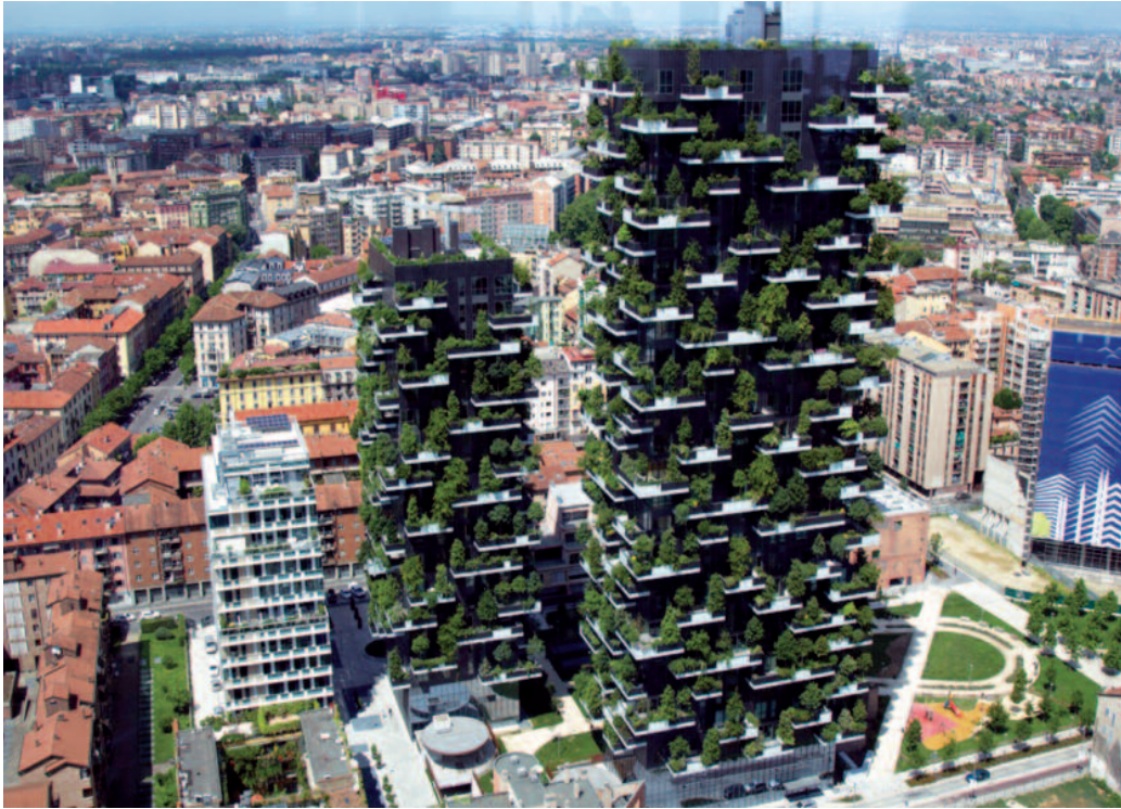
Fig. 5, 6, 7 - Il bosco verticale a Milano.

renewable sources also grow, but not everywhere in the same way. Germany is one of the leading countries in this regard, given that the goal is to reduce greenhouse gas emissions by 80-90% by 2050 and to bring renewable sources to cover 60% of the country's energy consumption. 2