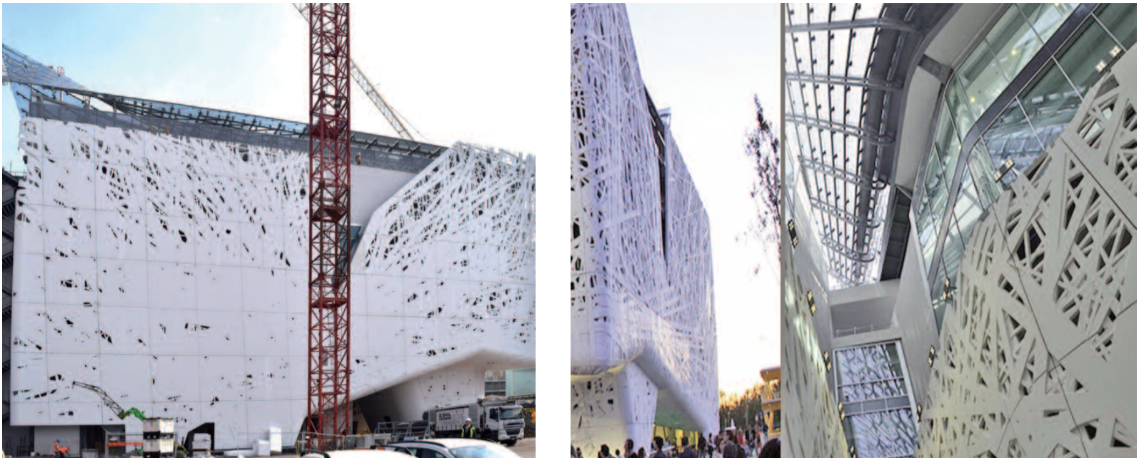
Figg. 3, 4 - Montaggio dei pannelli di cemento biodinamico i.active Biodynamic nel Padiglione Italia a Milano (Expo 2015).