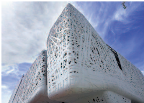
Fig. 1 - Padiglione Italia, Milano (Expo 2015).

Obiettivi di ricerca - Il presente articolo mette in evidenza il modo in cui il settore residenziale può svolgere un ruolo determinante nella mitigazione del microclima, rappresentando uno studio di base sulle caratteristiche di resilienza degli edifici realizzati con tecnologia green. Le tematiche della qualità ambientale degli spazi abitativi, dell'assenza di sostanze inquinanti, del contenimento dei consumi energetici nei fabbricati, con la conseguente riduzione delle emissioni di gas in atmosfera, assumono una crescente rilevanza. Le soluzioni resilienti sfruttano i principi del progetto bioarchitettonico che prevede l'impiego di materiali naturali e non tossici, preferibilmente di provenienza locale. La bioarchitettura, infatti, tende a esaltare il rendimento di luce e di energia solare; a evitare sperperi di acqua, calore ed energia; ad abbattere l'inquinamento elettromagnetico, chimico ed acustico; a ridurre i costi di gestione e di manutenzione. I regolamenti edilizi di nuova generazione diventano così una leva fondamentale per promuovere politiche ambientali ed energetiche innovative, mentre i Comuni italiani si pongono come luogo di elezione di una nuova progettua-