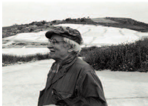
Fig. 2 - Alberto Burri (Gibellina, 1989).

Il progetto consisteva nel costruire un laboratorio , una struttura interattiva mobile: un grande cubo, che si apre sotto una tenda; questo dispositivo trasportato su di un camion di piccole dimensioni (come quelli da cantiere) permetteva di allestire le piazze della città vecchia con estrema semplicità. Una volta allestito il dispositivo consentiva al personale di interagire direttamente con la popolazione, utilizzando come mezzo di comunicazione principale l'arte e la produzione artistica "povera". Questo tipo di operazione si solidifica sul concetto del kunstwollen rieggiano e quindi sulla democraticità del saper fare popolare come forma d'arte, permettendo così di colpire il corpus culturale più profondo di una popolazione con un grado di conoscenza artistica mediamente basso. L'operazione di partecipazione artistica compiuta da Piano è fondamentalmente di stampo didattico; quello che appare estremamente rilevante è che