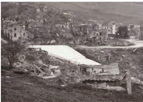
Fig. 1 - Alberto Burri, Il Grande Cretto di Gibellina (anni 1984-1989).

Il Grande Cretto a Gibellina e il Problema della Scala - Costruito dopo la catastrofe del Belice il Grande Cretto di Alberto Burri può essere considerata una tra le opere d'arte ambientale più prepotentemente emotive mai realizzate (Figg. 1, 2). L'opera consiste in uno stiracchiamento scalare dei classici "cretti" burriani in cui l'artista decide di ricoprire la collina che ospitava la cittadina scomparsa di uno strato di calcestruzzo che mima le tavole di terra elaborate fino a quel giorno; mostra come si possa congelare il momento in cui la terra ha tremato e si è aperta. L'operazione compiuta da Burri mette in gioco non solo il rapporto tra arte e città, ma anche tra la scala urbana e la dimensione dell'opera d'arte; tecnicamente costituisce uno dei primi esempi di land art a scala territoriale. Chi ha percorso le larghe spaccature della colata di cemento, che si estende per oltre ottantamila metri quadrati dove un tempo si trovava la cittadina trapanese di Gibellina, estinta nel 1968 dal terremoto, non può non riconoscere la potenza evocativa di questa memoria pietrificata. Il cretto