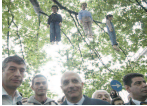
Fig. 5 - Maurizio Cattelan: i Tre bambini-manichini impiccati (2004).

The project consisted in building a laboratory, a mobile interactive structure: a large cube that opens under a curtain. This device transported on a small truck (such as a construction site) made it possible to set up the old town squares with extreme simplicity. Once set up, the device allowed the staff to interact directly with the population, using art as a main means of communication and 'poor' artistic production. This type of operation solidifies on the concept of 'kunstwollen' and hence on the democratic nature of being able to become popular as a form of art, thus enabling it to strike the deepest cultural corpus of a population with an average low artistic level of knowledge. The artistic participation of Piano is fundamentally a teaching tool. What seems extremely important is that this type of operation can be considered the progenitor of all those activities of contemporary participation. Perfectly in line with social speculation made in Italy in the 70s and 80s, it locates in the direct artistic experience the means for retraining space, it is not the work of art itself to be a reaction element, but is what remains after its move to reacting to the population. The spatial modification that this device leaves as a trace is almost nothing because of its intent and trigger long-term space-changing mechanisms that arise through a fleeting artistic experience that changes the awareness of the one who accomplished it. Creating a new know how to make a