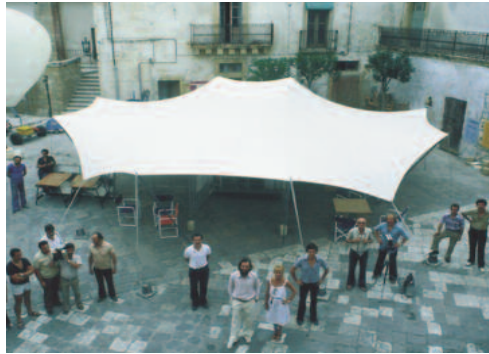
Fig. 4 - Renzo Piano: il Laboratorio di Quartiere a Otranto (1979).

The increase in urban voids, dictated by the change in production processes, causes the redesign of abandoned non-unit spaces to become a key theme in contemporary planning. The relationship between city and art is increasingly emphasizing itself as a component of architectural design in urban space, which has become a place of continuous change. The fruit of the synergy between the incessant creative process of contemporary art and mass production will be later analyzed as a tool for retraining urban fabric; a process more precisely identified in the capacity of some performance actions to trigger virtuous reactions. The decentralization of workplaces, coupled with the accumulation of large retail outlets, has led to a functional emptying of urban centers, thus generating the emergence of a series of empty spaces of moderate size and distributed more or less casual in cities. These voids cannot be assimilated only as physical absences, but also and above all as conceptual vacuum moments, semantic falls in the spatial continuity of historical centers. Precisely in these places, as we shall see later, there are three great examples of the interpretation of the semantic urban void: three intellectual operations that reacted and collaborated