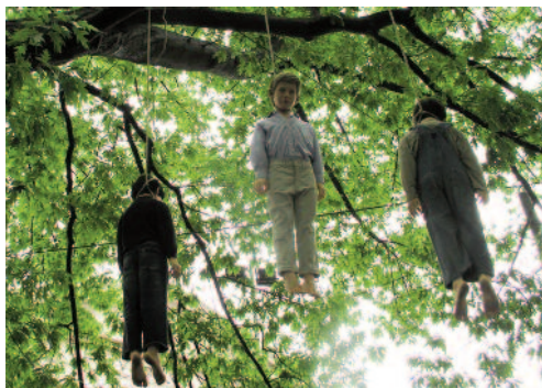
Fig. 6 - Maurizio Cattelan: i Tre bambini-manichini impiccati (2004).

Conclusion - The relationship between city and art is therefore an extremely important topic of interest, linked to the physical, economic and social changes of urban realities. Transnationalism means that news, ideas and ways of life are multiple, and communication and exchange of ideas are fast and free of borders, places are empty of meaning and require decisive action against them. The production processes that are now changed have different production sites, so this leads to an increase in these semantic urban voids, abandoned working spaces, and realities to rethink and reemphasize. Uses and customs change and diversify the practices of using urban spaces. As well as