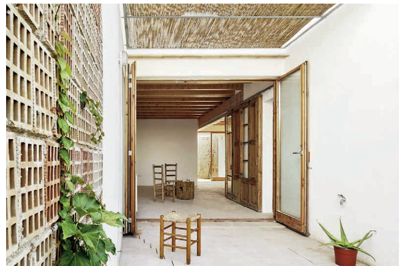
Figg. 3-5 | Life Reusing Posidonia in Islas Baleares (Spain), 2009-2017, designed by IVABI.