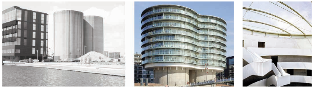
Fig. 7-9 | Frösilo in Copenhagen (Denmark), designed by MVRDV, 2002-2005: before and after the intervention.