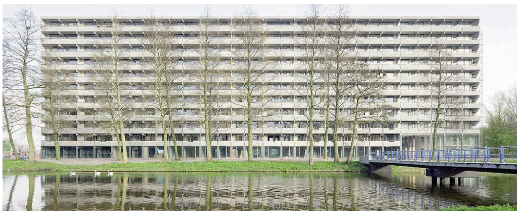
Fig. 6 | Deflat Kleiburg in Amsterdam, 2013-2016, designed by NL Architects and XVV architectuur.

Taking co-responsibility for architecture as a discipline is, therefore, the first step toward a mindset shift that will generate an ecological transition capable of assisting in the indispensable process of reversing global climate change, a crucial factor