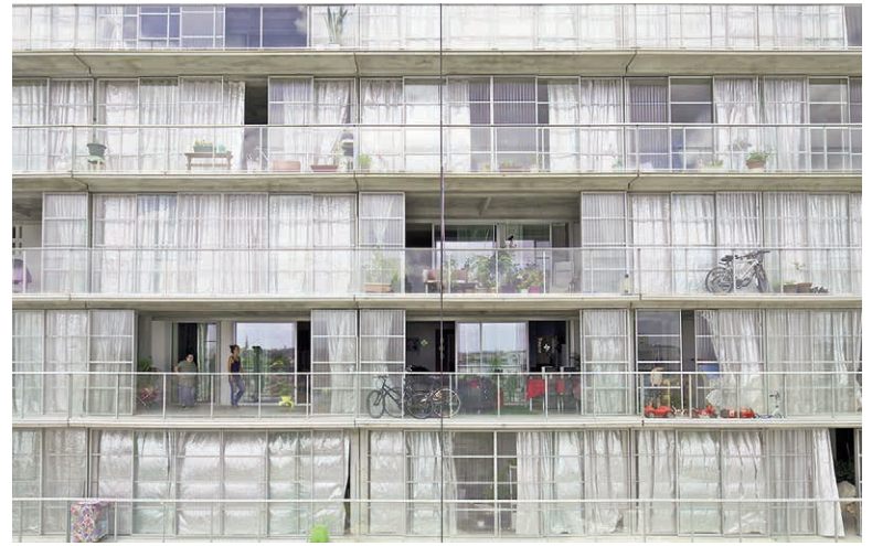
Figg. 1, 2 | 530 Collective Housing Grand Parc Burdeos (France), designed by Lacaton & Vassal, Frédéric Drout Architecture and Christophe Hutin Architecture, 2014-2018.