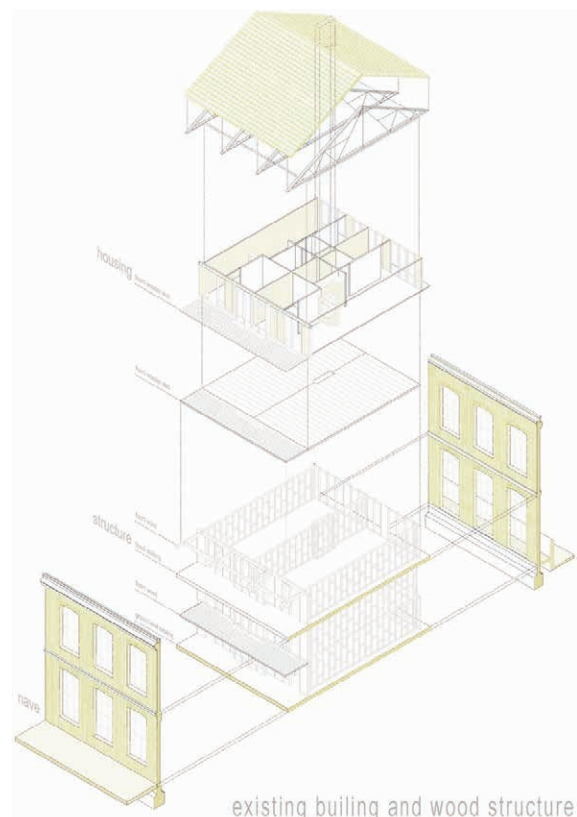
Fig. 10-13 | Viviendas en la nave de Fabra i Coats in Barcelona (Spain), designed by Roldán+Berengué, 2016-2019.