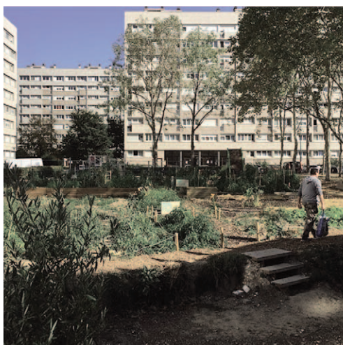
Fig. 8, 9 | Agrocité in Gennevilliers designed by Atelier d'Architecture Autogérée, 2020.

Experiences of regeneration: project specifications | The urban space adaptation project has to follow an inter-scalar approach, spreading between the architectural and the urban-territorial scale, that considers circularity and strategies based on nature. The regeneration of the city becomes a long process of modification of places, where the nature-based approach is considered as care and a tool for repairing the public space; this action is based on the one hand on the close observation of the elements present in a place, and on the other on the choice of strategic interventions (Clément, 2012). In the essay, nine European case studies have been analysed through the interpretation structure (mentioned in the previous paragraph) to understand the possible im-