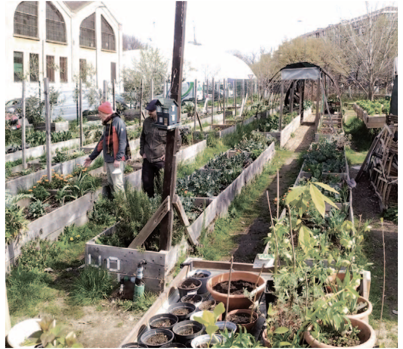
Fig. 10 | Ferme du Rail in Paris designed by Grand Huit architecture + Melanie Drevet, 2020. Fig. 11 | Vegetable gardens of via Padova in Milan by Legambiente Reteambiente Milano, 2012.

plications of urban agriculture in architecture. Different forms of urban agriculture are applied to projects of variable dimensions, from the urban to the architectural scale, giving feedback to the project's approaches and morpho-typological implications.