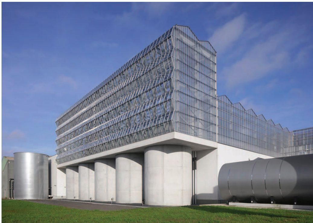
Fig. 1 | Agrotopia in Roeselare designed by Meta Architectuurbureau, 2021 (source: dezeen.com, 2022).